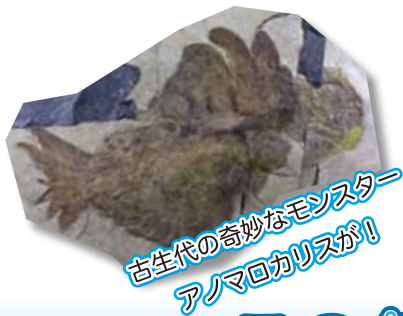
古生代の奇妙なモンスター アノロカリスが!

地球が誕生してから46億年。私たち現代の人間が誕生するまでの間、地球やそこに住む生き物たちはどのような道のりを歩んできたのでしょうか。約38億年前の地球最古の岩石、ようやく現れた大型生物エディアカラ生物の化石、陸上に出現した植物化石や、恐竜の全身骨格、そして私たち哺乳類の化石などの標本・資料と一緒に、地球のれきし・生命のれきしをたどる46億年のものがたりへご招待します。