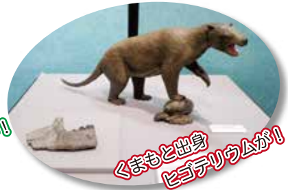
くまもと出身 ビゴテリウムが!