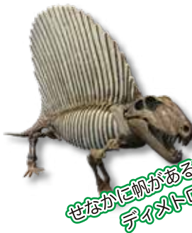
せなかに帆がある ティタノロドンが!