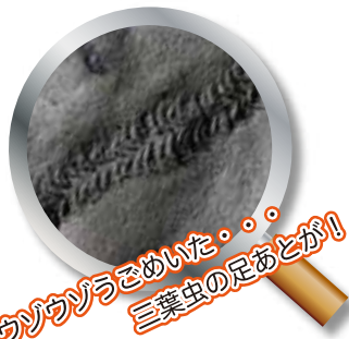
ウツウツとぞめいた・ 三葉虫の足あとが!