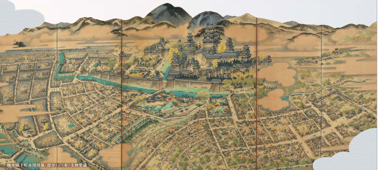
熊本城下町並図屏風(部分) / (有)文林堂蔵