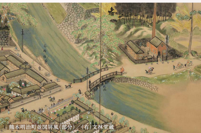
熊本明治町並図屏風(部分) / (有)文林堂蔵