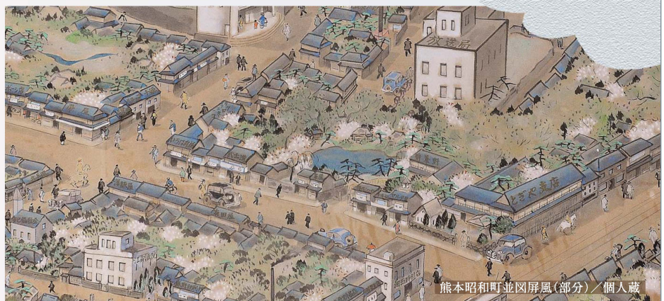
熊本昭和町並図屏風(部分) / 個人蔵