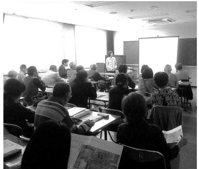
資料館講座記念講演