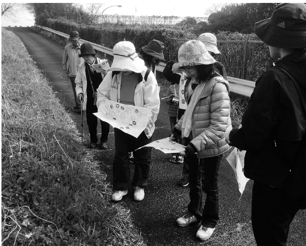
学芸員と歩く野外博物館