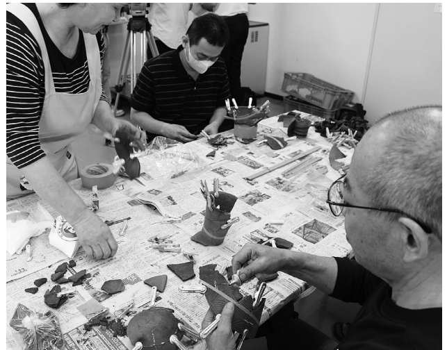
土器修復体験講座