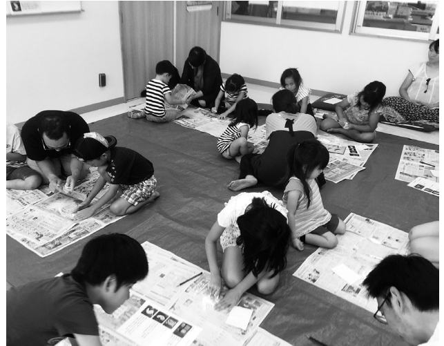
城南児童館（勾玉づくり）