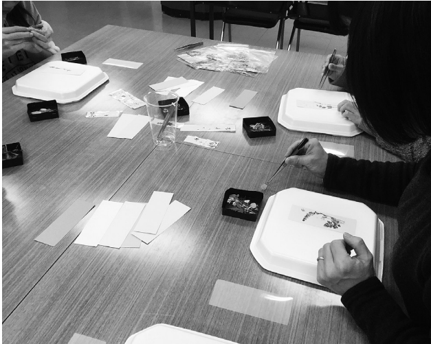
押花しおりづくり