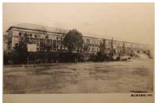
隈庄尋常高等小学校 校舎写真