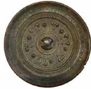
秋只古墳出土 神獣鏡