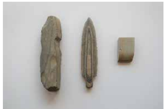
上の原遺跡出土 扁平片刃石斧・柱状片刃石斧