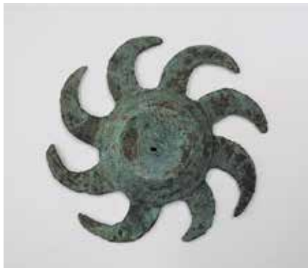
新御堂遺跡出土 巴形銅器