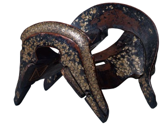
鎌倉時代の貴重な螺鈿靴 重要文化財《巴螺鈿靴》 鎌倉時代(13世紀) 熊本県立美術館蔵 撮影:熊本県立美術館