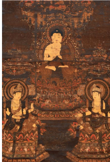
極楽浄土の世界を描いた鎌倉時代の仏画 (後期展示) 熊本県指定重要文化財 《阿弥陀三尊図》鎌倉時代(14世紀) 往生院蔵