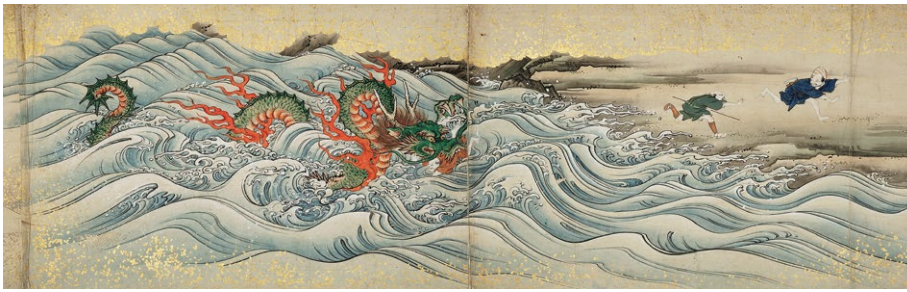
ちへんじ 龍伝説が残る池辺寺の物語を伝える絵巻 熊本市指定有形文化財《池辺寺縁起絵巻》 文化元年(1804) 池辺寺跡財宝管理委員会蔵(熊本県立美術館寄託)