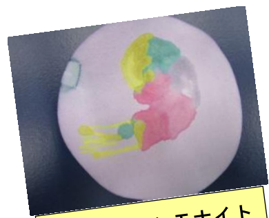
カラフルアンモナイト