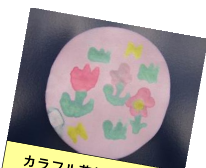
カラフル花畑・花広場