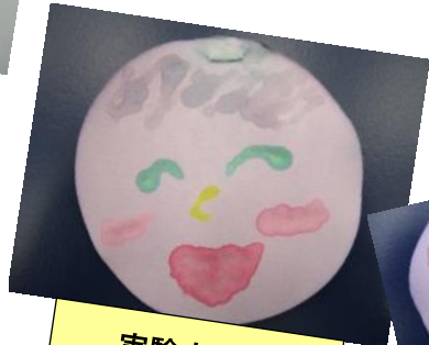
実験大好き ニコニコえがお