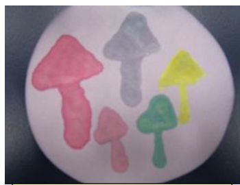
ソライロタケ 変異株