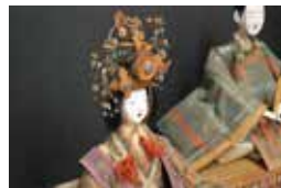
親王飾り（享保ひな）

そこで、この企画展では、ひな祭りの展示を通して、日本文化の魅力と地域文化の多様性をご紹介します。