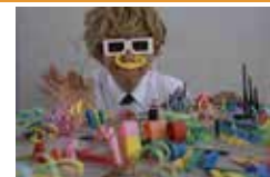
※当日、14:10～のプラネタリウムの放映は休止します。