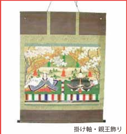
掛け軸・親王飾り