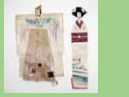
親王飾り (八朔びな)