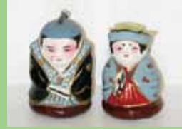
福助夫婦 (浜松張子)