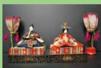
親王飾り (古今びな)