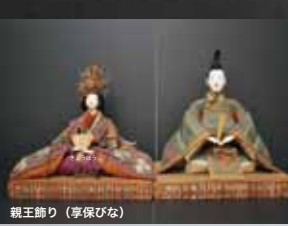
親王飾り (享保びな)