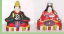
親王飾り (中山土人形)