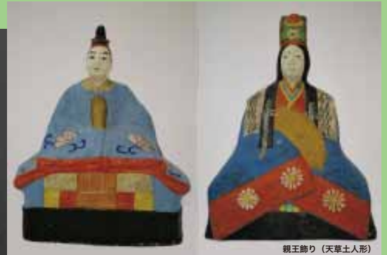
親王飾り (天草土人形)