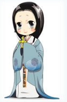
熊本県立美術館マスコットキャラクター 細川ガラシャさま