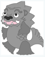
熊本博物館キャラクター しゃちべえ