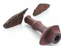
上代遺跡赤漆塗木製剣柄

7月20日(土)～ 常設展示室1階 考古展示エリア 普段は収蔵庫に眠っている出土品のうち、今回は「鏡・玉・剣」をテーマに、選りすぐりの逸品を展示します。