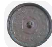
五丁中原遺跡小型仿製鏡